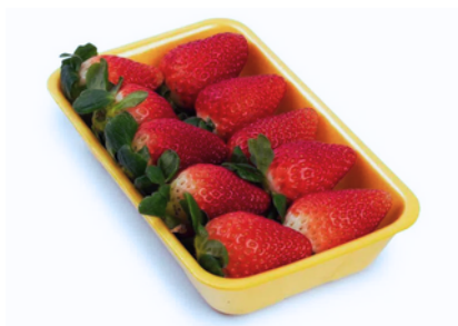
Imagem 1. Bandeja de morango Premium