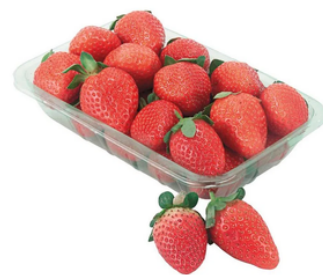
Imagem 3. Bandeja de morango Médio