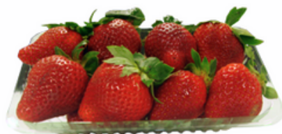
Imagem 2. Bandeja de morango Graúdo