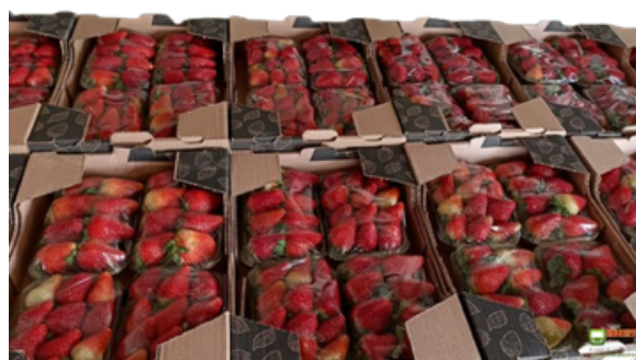
Imagem 5. Caixas de papelão para o morango